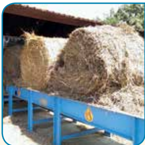
Table de service motorisée

Broie la balle à travers un rotor de coupe. Deux racleurs à chaîne entraînent la balle en rotation et assurent un enlèvement uniforme de la matière.